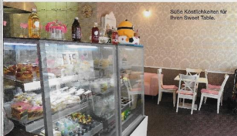
Süße Köstlichkeiten für Ihren Sweet Table.