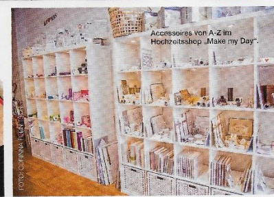
Accessoires von A-Z im Hochzeitsshop „Make my Day“.