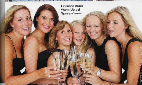
Exklusiv: Braut Warm Up bei Sposa-Vienna.