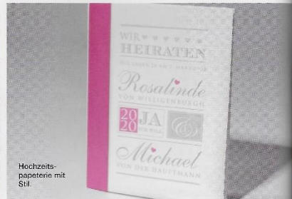
Hochzeitpapiererei mit Stil.