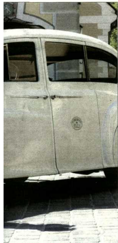
ein absolutes Muss für Heiratswillige